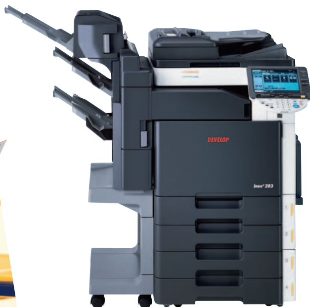
ineo + 203 mit automatischem Vorlageneinzug (DF-611), internem Finisher (FS-519), Heft- und Falzeinheit (SD-505) und 2 x Universalkassette (PC-204)